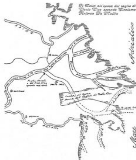
Fig. 4 - Anno 1684. Il delta all'epoca del taglio di Porto Vero, secondo Girolamo Antonio De Mattia.