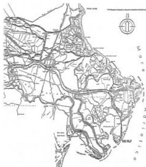
Fig. 7 - Il delta del Po negli anni 50.