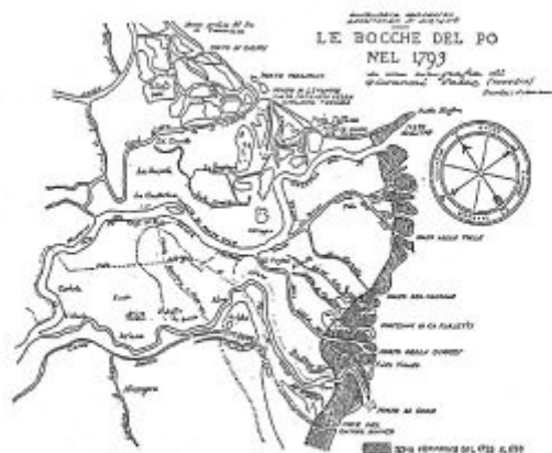
Fig. 6 - Le bocche del Po nel 1793 da una cartografia di G. Vals.